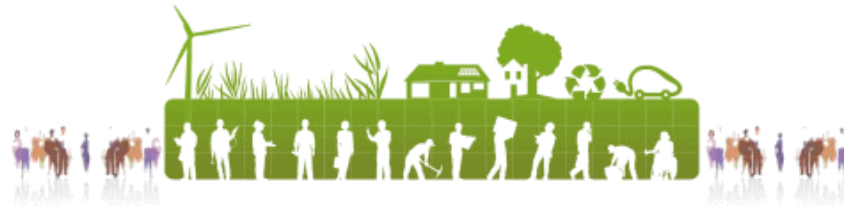
TABLEAU DE SYNTHESE